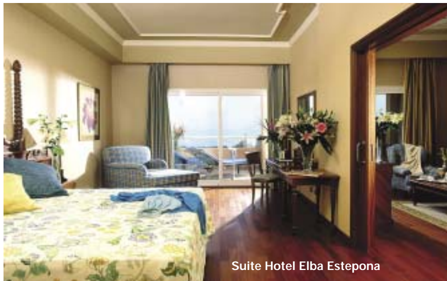
Suite Hotel Elba Estepona

Para el control de la climatización del hotel se distribuyeron ocho cuadros de control en las diferentes salas técnicas para conseguir un ahorro en el cableado y en la mano de obra necesaria para el conexionado de todos los elementos de campo. Se utilizaron 5 centrales DDC3200 y diferentes módulos FBR5, SBM y FBM repartidos por los diferentes cuadros de control.