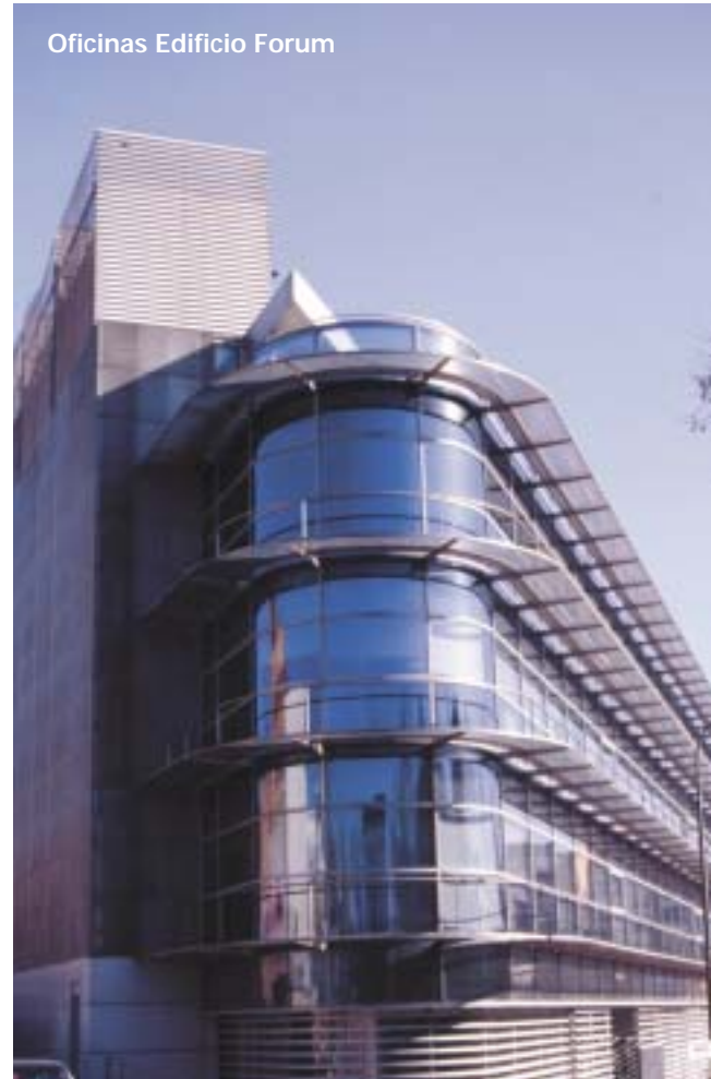
Oficinas Edificio Forum

RS232 de la última de ellas se cablea un módulo GLT2222H para amplificar la señal que une la central DDC3000 al ordenador de Gestión Técnica GLT4002 N.