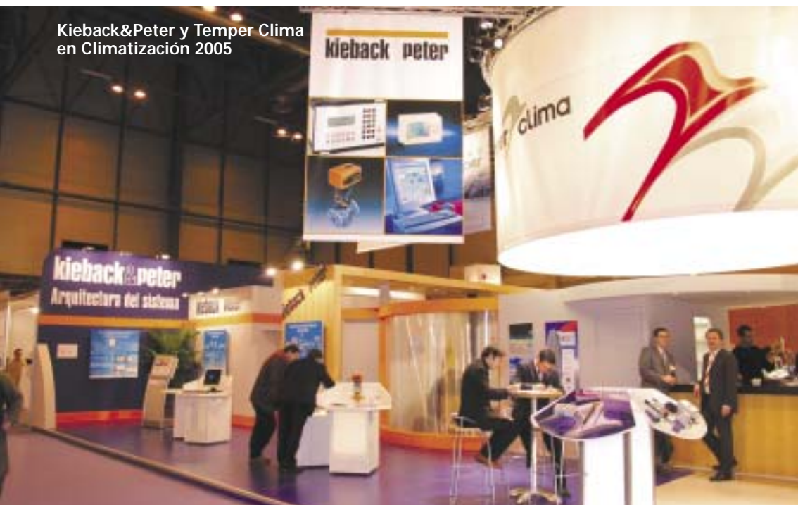
Kieback&Peter y Temper Clima en Climatización 2005